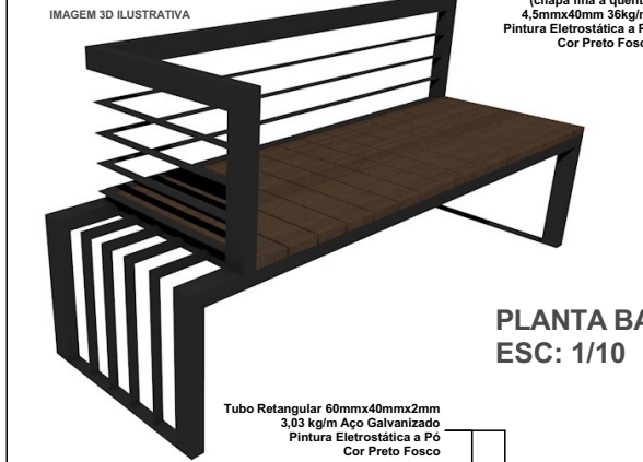
PLANTA BAIXA ESC: 1/10